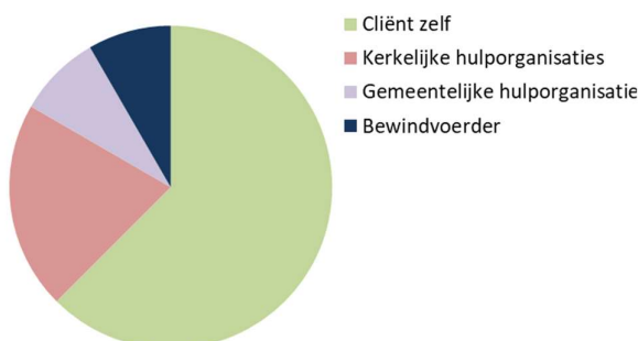
Figuur 1. Herkomst van hulpvragen in 2022

In 2022 zijn 24 hulpvragen binnengekomen. Zeker de helft van de aanvragen kwamen binnen als een persoonlijk verzoek via de website van Noodfonds Wageningen. Daarnaast kwamen er aanvragen binnen via Schulphulpmaatje (ISOFA) en Humanitas, of in samenspraak met een bewindvoerder. Ook werd er soms doorverwezen door het Regionale Instelling Beschermd Wonen (RIBW). In figuur 1 ziet u een verdeling van herkomst van hulpvragen zoals ze in 2022 binnenkwamen. Overigens moet hierbij gemeld worden, dat sommige aanvragen van cliënten zelf, gedaan worden na een tip van een hulpverlener van een hulporganisatie.